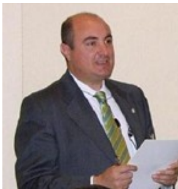
imagen ante los clientes de mayor relevancia en el ámbito económico-empresarial del país y generaban sinergias de todo tipo, permitiendo la introducción de otros productos y servicios en las empresas de los clientes.

Pronto las empresas de seguridad descubrieron que el escolta era algo más que protección y contrato por dinero, era una fuente de buena